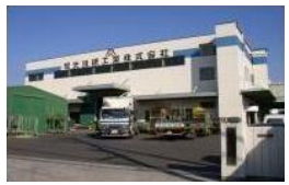
金型事業部 碧南事業所