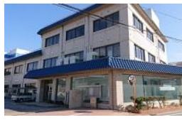
工機事業部 碧南事業所